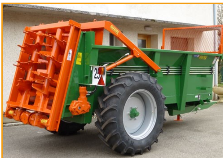
E 40 option porte hydraulique

Porte arrière hydraulique à compas Flèche à ressorts Volets Béquille hydraulique Commande électrique du tapis Centrale hydraulique